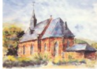
Aquarell von Pfr. Christoph Henkel +