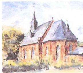
Aquarell von Pfr. Christoph