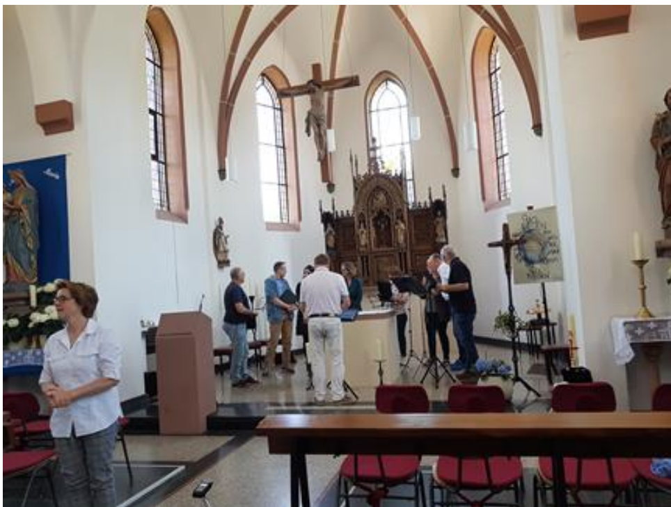
Auftritt von 8 Solosängern am 16. Juni 2024 in unserer Kirche Sankt Martinus zu Abenden.